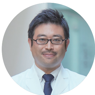
脳神経内科 神経内科専門医／脳卒中専門医