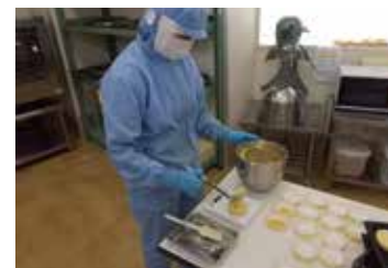
みなとワークアクティでのお菓子作り