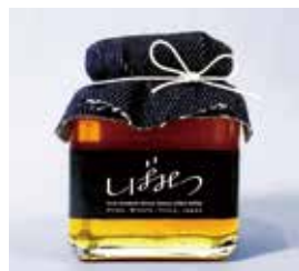
港区芝地区総合支所の芝 BeeBee's プロジェクトで採れた『しばみつ®』

様々な出会いがご縁となりご支援いただいています。また、現在当院はソーシャルインクルージョンの実現に向け、新しい病院のカタチを常に模索しています。みんなとプロジェクトの活動を通して、働きがいのある職場づくり、広く地域の皆さんに足を運んでもらえる空間づくり、地域とのつながりを通して、健全なまちづくりと健康づくりへの貢献を進めています。今後もさらに多くの区民の皆さんに参画していただけるよう活動の場を広げていく予定です。