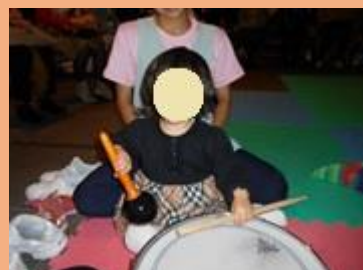
スネアとマラカス、どちらも得意