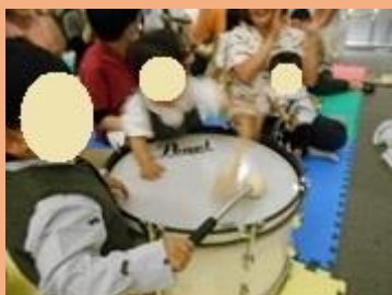
演奏に合わせて、「ドーン」