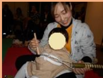
塚田先生手作りの楽器だよ