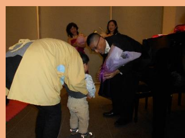
みんなを代表し僕から花束贈呈