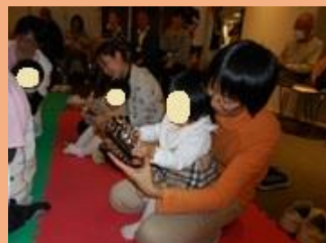
スレイベルの音色はきれいだね