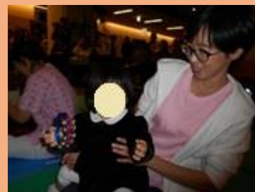
鈴の音はかわいいし楽しいよ