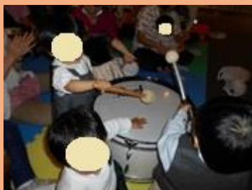
大きな太鼓にみんな興味津々