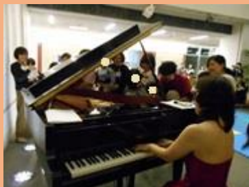
グランドピアノの中を覗きました